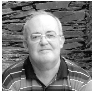
Por: José Lapa

O mundo é o mesmo de sempre, cheio de sombras e de expectativa.